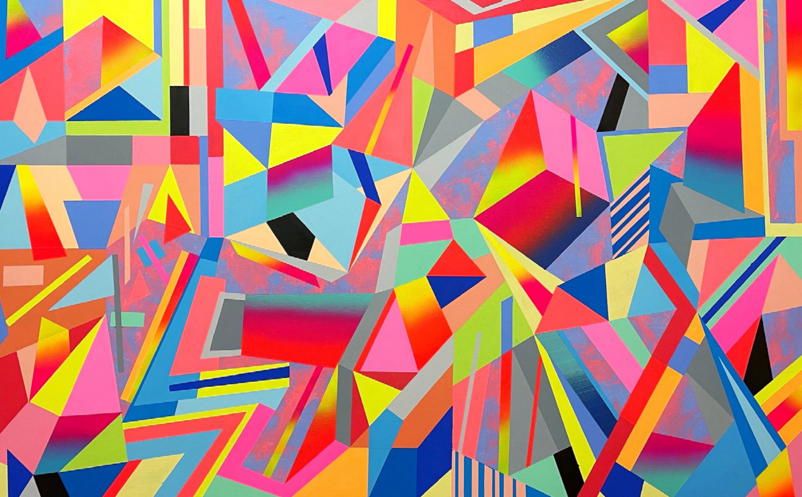
Fig. 2: Danilo Cedillo, Intrincado , 2021. Pintura acrílica y aerosol, 90 × 75 cm.