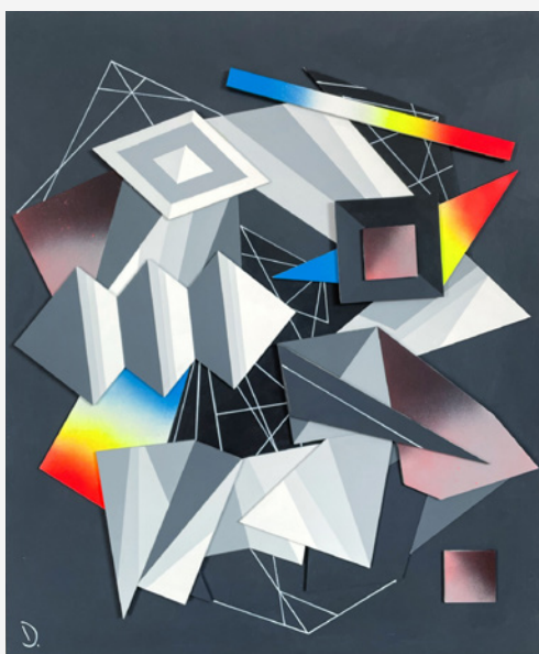
Fig. 3: Danilo Cedillo, Danilo , 2022. Pintura acrílica y aerosol, recorte láser, 70 × 80 cm.