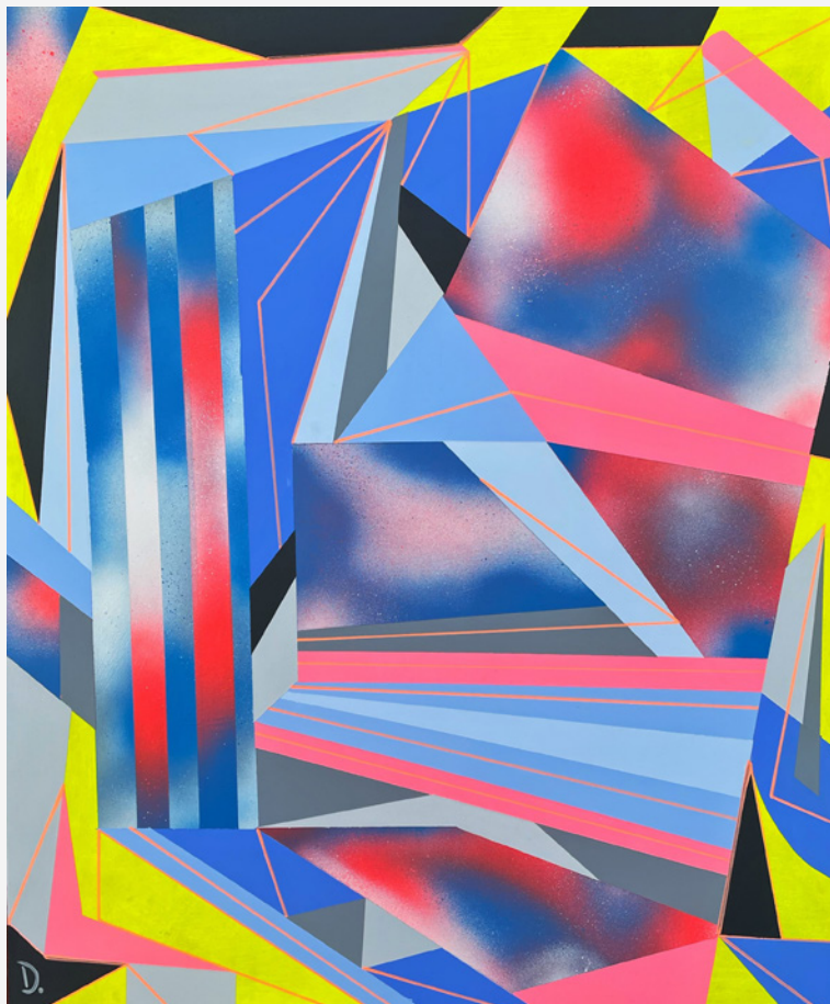
Fig. 5: Danilo Cedillo, Materia y energía , 2022. Pintura acrílica y aerosol, 70 × 80 cm.

«En cada trazo intento manifestar intensidad, inspiración y reflexión hasta lograr una expresión artística genuina para el público.»