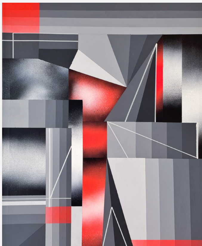
Fig. 1: Danilo Cedillo, El auge del monocromo , 2023. Pintura acrílica y aerosol, 40 × 50 cm.

« Siento que cada una de mis obras es un testimonio de la búsqueda constante de la esencia visual, que lleva a los espectadores a un viaje más allá de lo figurativo, hacia un reino lleno de sensaciones y emociones profundas. »